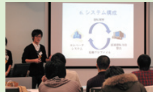
最終日プレゼンの様子