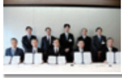
協力各社の代表による調印式

平成21年12月9日に三井物産(株)本店において、次の各企業と「海外インターンシップに関する協定書」の調印式を実施しました。