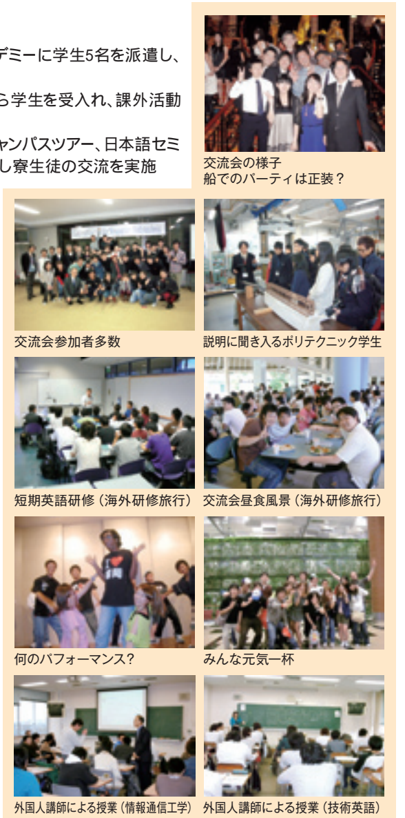
交流会の様子 船でのパーティは正装? 交流会参加者多数 説明に聞き入るポリテクニク学生 短期英語研修(海外研修旅行) 交流会昼食風景(海外研修旅行) 何のパフォーマンス? みんな元気一杯 外国人講師による授業(情報通信工学) 外国人講師による授業(技術英語)