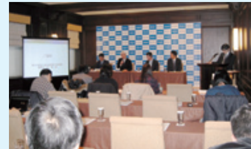
共同発表(記者会見)の様子

高専生が国際的な技術コンテストImagine Cup(日本大会または世界大会)に挑戦および出場することを目指すとともに、これを組織的に支援することで、世界に通じる高度IT人材を育成します。