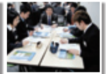
受入れ企業の個別説明