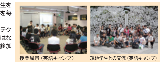
授業風景(英語キャンプ) 現地学生との交流(英語キャンプ)