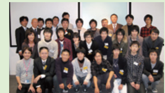
参加者・講師陣による記念撮影